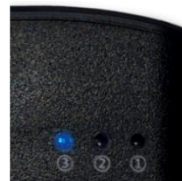
③長時間使用モード