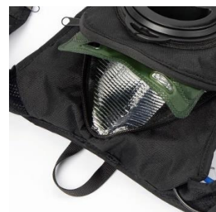
▲タンク内装は保冷バッグ仕様