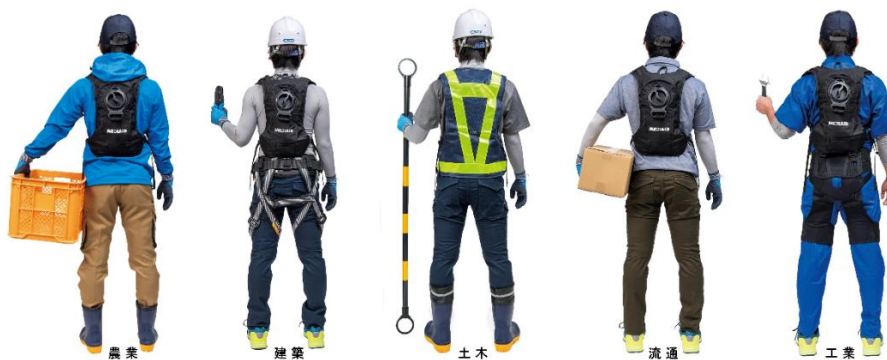
▲業種別装着イメージ