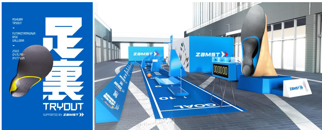
「足裏TRYOUT supported by ZAMST」イベントビジュアル・会場イメージ