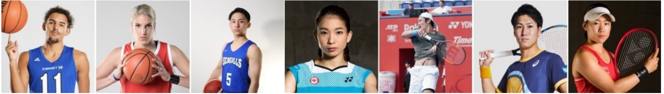
バスケットボール:トレイ・ヤング、エレナ・デレ・ダン、河村勇輝、バドミントン:松友美佐紀、テニス:伊藤竜馬、綿貫陽介、日比野菜緒

ZAMST はバレーボール、バスケットボール、テニス、バドミントン、サッカーなど、あらゆるスポーツにおいて限界に挑み続けるアスリートや団体を応援しています。